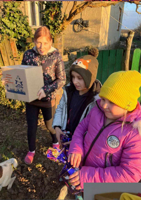
Utdeling av julepakker på et barnehjem for barn med funksjonshemming.