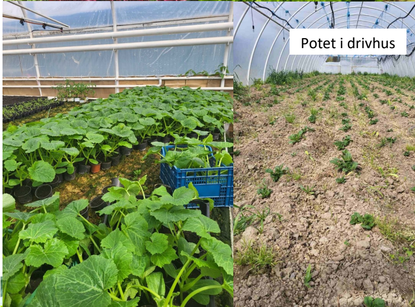
Potet i drivhus